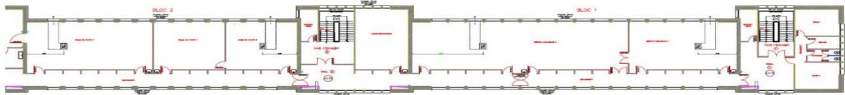
Plan du 1 er étage entre les cages 1 et 3